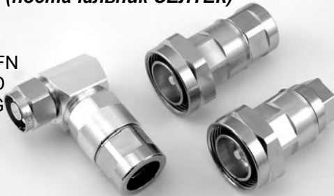
Серія N Серія 7-16 прямі та кутові

RFX 1/2"-50 LCF 12-50J LCF 12-50JFN 5128 1/2"-LD HFC 12D LG HPL 50-1/2" LDF4-50A